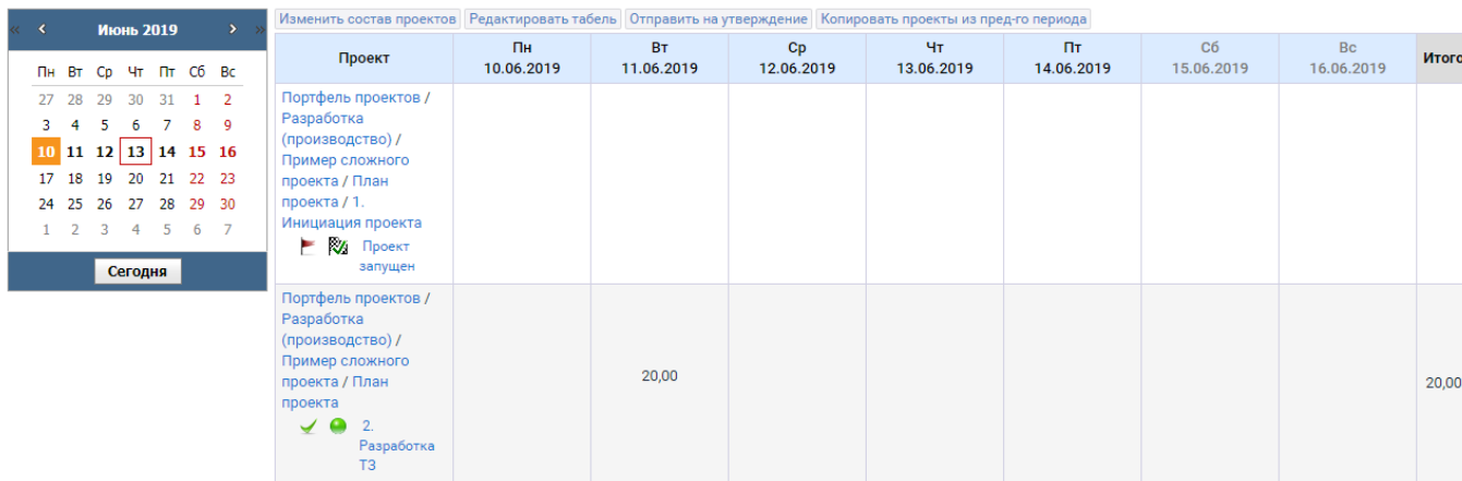
Рисунок 1 – Раздел «Учет времени»

Добавлять в табель начатые и завершенные задачи, если я ресурс : включено