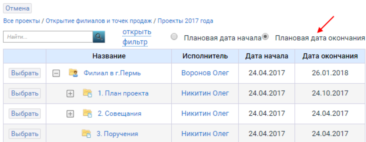
Рисунок 2 – Выбор задачи для связи с датой

4. При необходимости укажите отклонение от выбранной даты (может быть как положительным, так и отрицательным) (Рисунок 3).