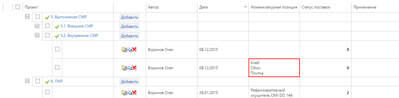
Рисунок Imp.3 – Справочник с реквизитом-классификатором, у которого разрешен выбор нескольких значений

разрешен выбор нескольких значений, следует все требуемые для одной строки справочника значения реквизита-классификатора располагать в одной ячейке файла MS Excel, друг под другом. Это можно сделать с помощью сочетания клавиш Alt+Enter: следует ввести первое значение, затем создать следующую строку в ячейке, нажав Alt+Enter, после чего в следующую строку ввести второе значение и т.п.