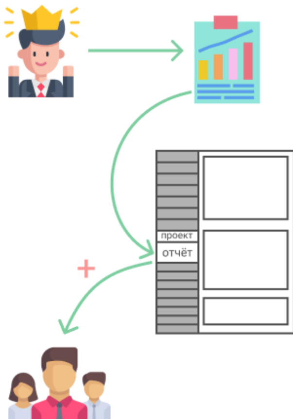
Рисунок 3 – Логика привязки отчёта к модулю на рабочем столе

Хороший вариант, когда отчёт по своему содержанию охватывает всю иерархию дерева проектов .