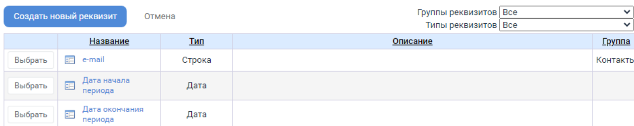
Рисунок 1 – Добавление реквизита объекту

Прямо из этого окна можно создать новый реквизит: